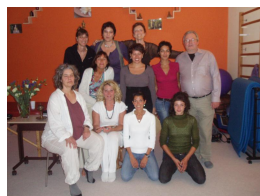
Une des dernières promotions en massage thérapeutique...

Tram : 12 et 16 : Place Favre 17 : Chêne - Bourg